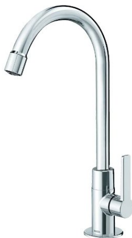
Modelo de torneira a ser seguido na bancada da sala de esterilização

A torneira será de mesa de bica alta em metal cromado com acionamento manual por alavanca.