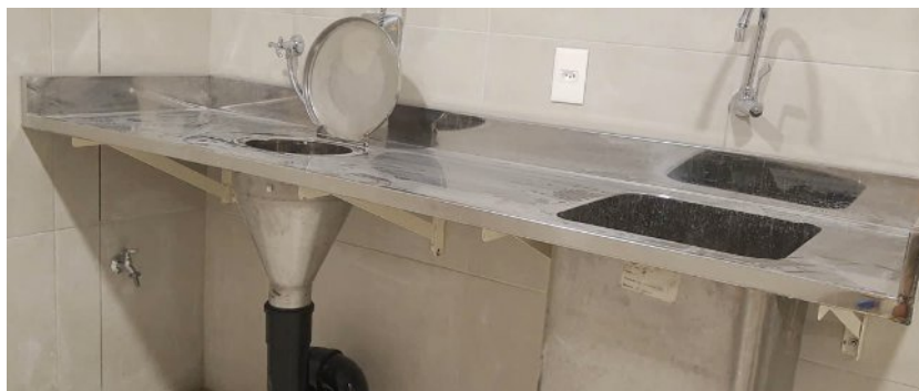
Exemplo de bancada conjunta com cuba e cone