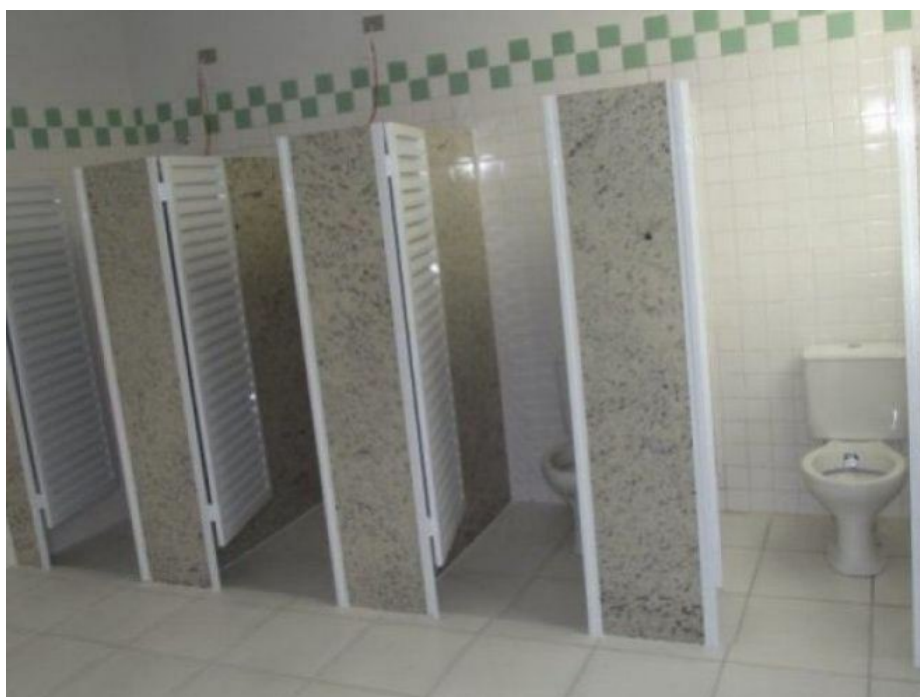
Imagem demonstra o modelo das portas de alumínio e a forma de instalação do granito com espessura de 3cm (a cor das divisórias será cinza andorinha)

As portas das cabines serão em alumínio branco instaladas a altura de 20cm do piso e até altura de 2,00m, ou seja, as dimensões das portas serão de 60x180cm. Os trincos das portas serão do tipo targeta livre/ocupado em material cromado. No boxe do chuveiro será instalado soleira em granito cinza andorinha de 3cm de largura e 3cm de altura em todo o comprimento do vão da porta.