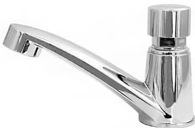
Modelo de torneira a ser seguido na bancada em granito

As torneiras serão de mesa, em metal cromado, bica baixa e acionamento por pressão e fechamento automático temporizado.