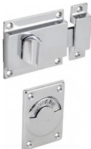
Modelo de trinco targeta livre/ocupado